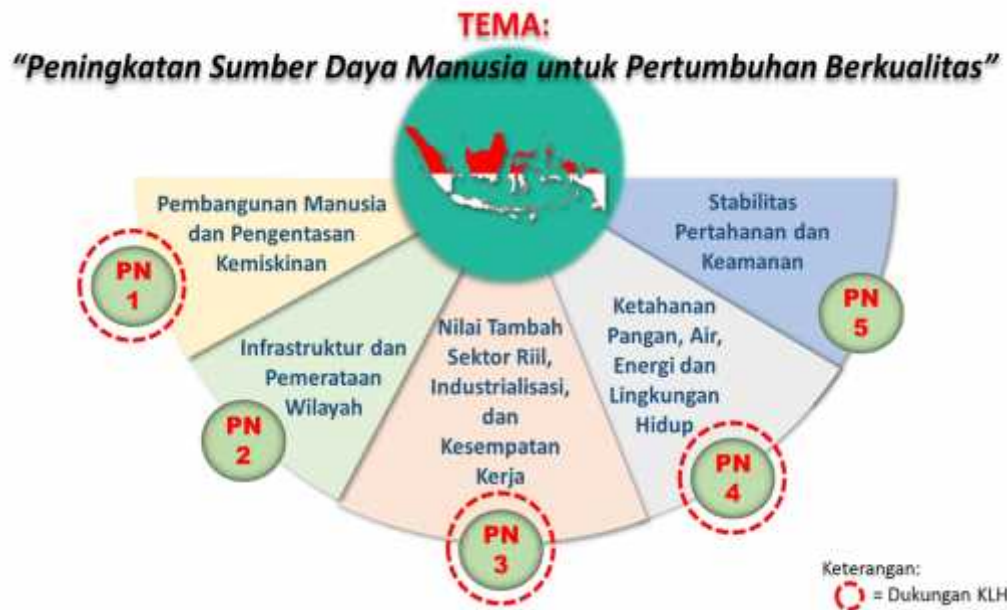
Gambar 1. Dukungan Kementerian LHK pada Prioritas Nasional Tahun 2020

Dalam rangka mendukung capaian keberhasilan pembangunan lingkungan hidup dan kehutanan tersebut yang berfokus pada Pembangunan Sumber Daya Manusia yang Berkualitas, Badan Penyuluhan dan Pengembangan SDM berperan dalam 3 (tiga) prioritas nasional melalui Program Peningkatan Penyuluhan dan Pengembangan SDM dengan Indikator Kinerja Program, yaitu: KHDTK yang Dikelola secara Efektif dan Berkelanjutan, Peningkatan Kompetensi dan Sertifikasi SDM LHK, Lembaga Pelatihan Pemagangan Usaha Masyarakat, Jumlah Lembaga/Komunitas serta Generasi Peduli dan Berbudaya Lingkungan Hidup.