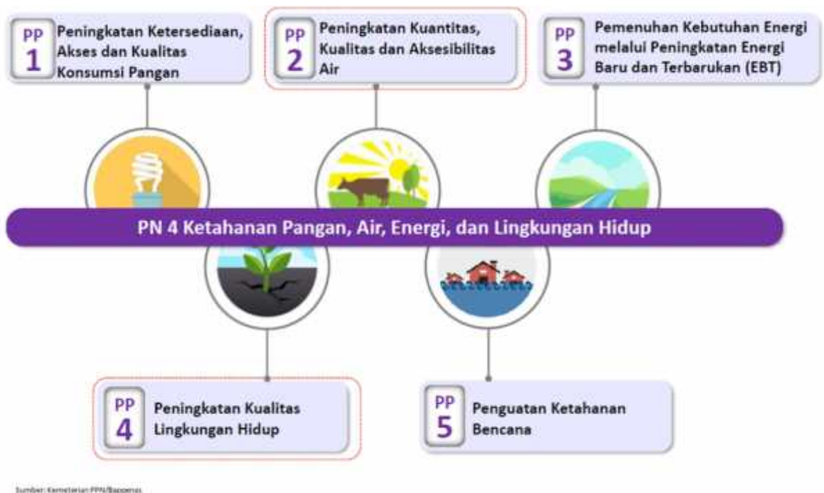
Gambar 5. Dukungan Balai Diklat LHK Kadipaten Pada Prioritas Nasional 4

Pada Prioritas Nasional keempat (Pemantapan Ketahanan Energi, Pangan, Dan Sumber Daya Air), Balai Diklat LHK Kadipaten mendukung Program Prioritas Peningkatan Daya Dukung Sumber Daya Alam dan Daya Tampung Lingkungan (PP4) . Kegiatan tersebut melalui pelaksanaan diklat aparatur dan non aparatur. Kegiatan Prioritas Pecegahan Kerusakan Sumber Daya Alam dan Lingkungan Hidup (KP1) , serta termasuk ke dalam Proyek PN-4. Melalui kegiatan – kegiatan yang dilakukan diharapkan masyarakat akan menjadi semakin sadar untuk menjaga lingkungan serta berdampak positif terhadap kondisi lingkungan di sekitarnya. Gambaran lebih rinci dukungan Balai Diklat LHK Kadipaten pada Prioritas Nasional keempat seperti pada Gambar 5 dan Tabel 12 berikut.