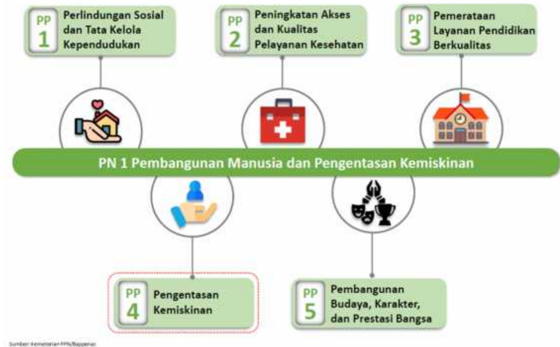
Gambar 3. Dukungan Balai Diklat LHK Kadipaten Pada Prioritas Nasional

Kadipaten pada Prioritas Nasional pertama seperti pada Gambar 3 dan Tabel 10 berikut.