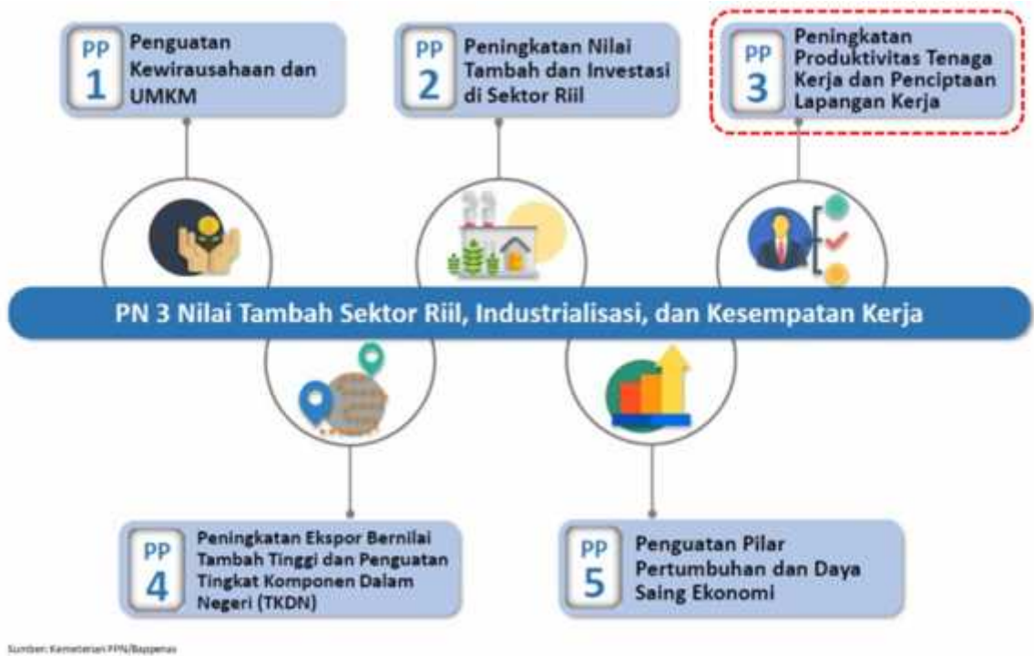
Gambar 4. Dukungan Balai Diklat LHK Kadipaten Pada Prioritas Nasional 3

pada Prioritas Nasional ketiga seperti pada Gambar 4 dan Tabel 11 berikut.