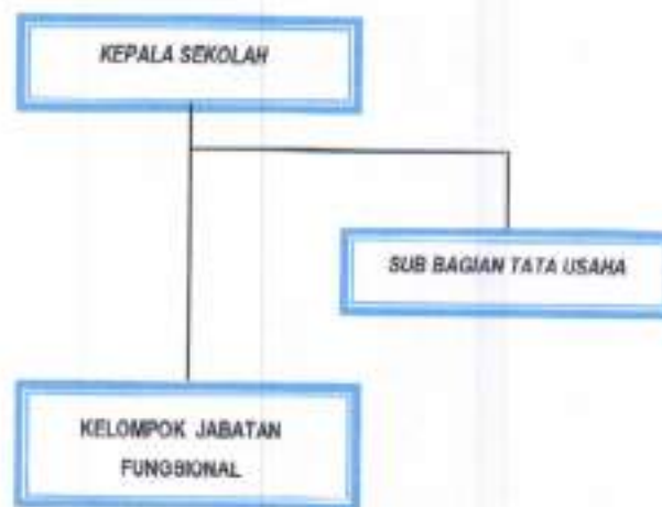
Gambar 1. Struktur Organisasi Sekolah Menengah Kejuruan Kehutanan Negeri Samarinda berdasarkan Peraturan Menteri Lingkungan Hidup dan Kehutanan Nomor P.17/Menlhk/Setjen/OTL.0/1/2016