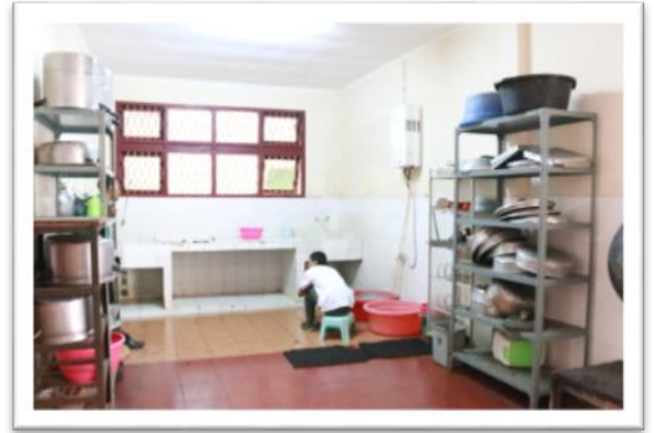
Gambar 14. Kondisi Asrama dan Dapur Pusat Diklat SDM LHK