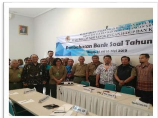
Gambar 4. Kegiatan SMK Kehutanan