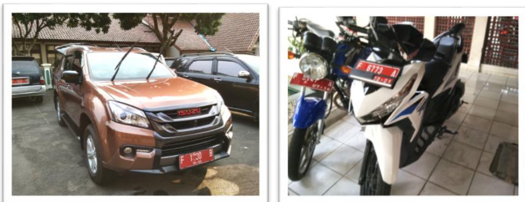
Gambar 12. Kendaraan Bermotor Inventaris Pusat Diklat SDM LHK

Kendaraan merupakan salah satu unit pendukung pelaksanaan kegiatan organisasi yang sangat diperlukan keberadaannya. Oleh karenanya agar dapat tetap berfungsi dengan optimal perlu dilakukan pemeliharaan dengan kegiatan berupa perbaikan, rehabilitasi, pembayaran pajak kendaraan bermotor, dan penyediaan bahan bakar. Perawatan meliputi: kendaraan pejabat Eselon II, kendaraan operasional roda-4, pemeliharaan kendaraan operasional roda-2, biaya pemeliharaan dan operasional Kendaraan Roda 6 serta biaya pemeliharaan dan operasional kendaraan operasional lapangan (double gardan). Alokasi anggaran untuk kegiatan ini dalam pagu adalah sebesar Rp356.330.000,- .