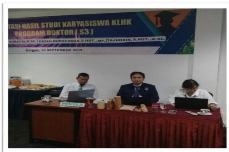
Gambar 8. Kegiatan Presentasi Hasil Studi Karyasiswa Program Doktor (S3)