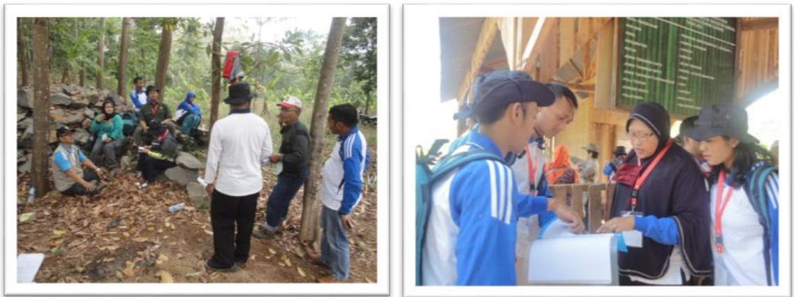
Gambar 9. Kegiatan Lapangan Pelatihan Dasar CPNS

Untuk pelaksanaan Pelatihan Dasar CPNS formasi tahun 2020 sudah dianggarkan untuk 450 orang. Pelatihan dasar bagi CPNS ini merupakan salah satu persyaratan untuk diangkat menjadi PNS sesuai dengan UU no 5 tahun 2014 tentang Aparatur Sipil Negara. Adapun anggaran untuk membiayai pelatihan dasar tersebut adalah sebesar Rp4.183.200.000,- .