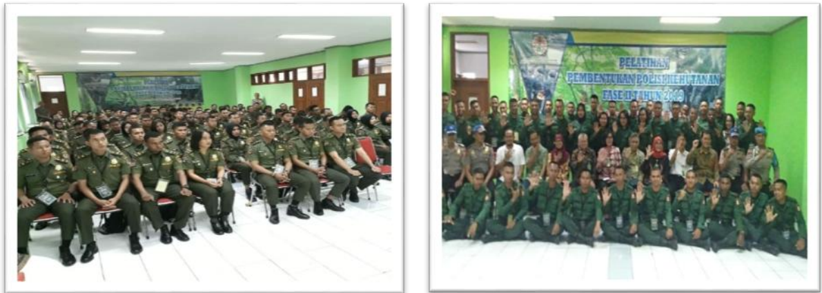
Gambar 5. Pelatihan Pembentukan Polhut Fase II