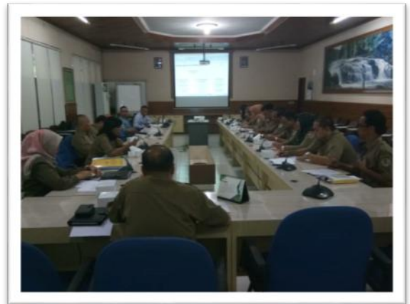
Gambar 10. Kegiatan audit ISO 9001 : 2015 oleh PT. IMS International (Integrated Management Services) International