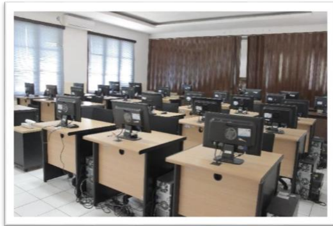
Gambar 11. Ruang Komputer Pusat Diklat SDM LHK

kerja dimaksud dapat berfungsi dan layak digunakan. Alokasi anggaran untuk kegiatan ini dalam pagu adalah sebesar Rp233.208.000,- .