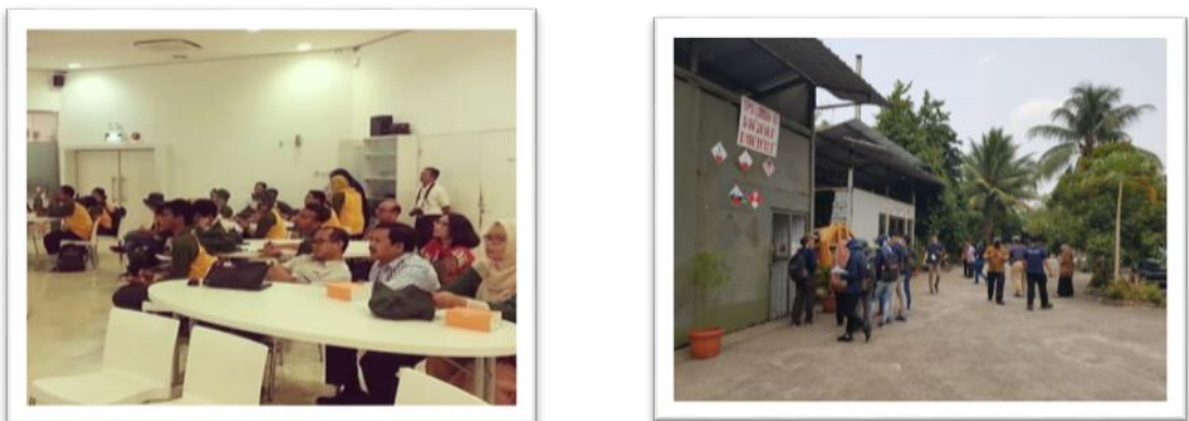
Gambar 6. Kegiatan Praktek Diklat Pengawas Lingkungan Hidup