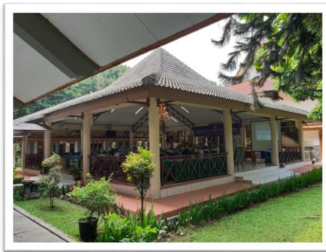
Gambar 13. Ruang Serbaguna Pusat Diklat SDM LHK

Kegiatan pengadaan peralatan dan fasilitas perkantoran berupa pengadaan seragam pramubakti. Anggaran kegiatan ini dalam pagu APBN adalah sebesar Rp16.150.000,- .