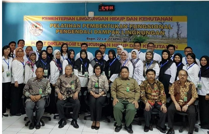
Gambar 7. Kegiatan Pembukaan Pelatihan Pembentukan Fungsional

sebanyak 60 orang dan anggaran yang disediakan adalah sebesar 368.880.000,- .