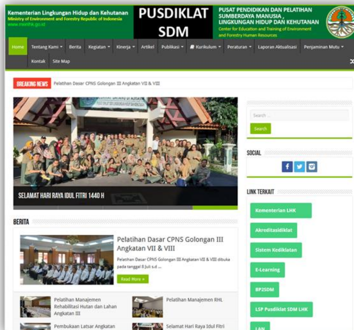
Gambar 3. Website http://portal.pusdiklatsdmlhk.id

Dalam era informasi dan komunikasi yang semakin canggih, maka diklat lingkungan hidup dan kehutanan telah mengembangkan suatu teknologi informasi dan komunikasi dalam rangka memperluas publikasi kediklatan serta akselerasi komunikasi kediklatan di seluruh unit kerja lingkup Pusdiklat SDM LHK melalui website http://portal.pusdiklatsdmlhk.id untuk operasional pengelolaan dan pengembangan sistem informasi kediklatan/website dialokasikan anggaran dalam pagu sebesar Rp29.550.000,-